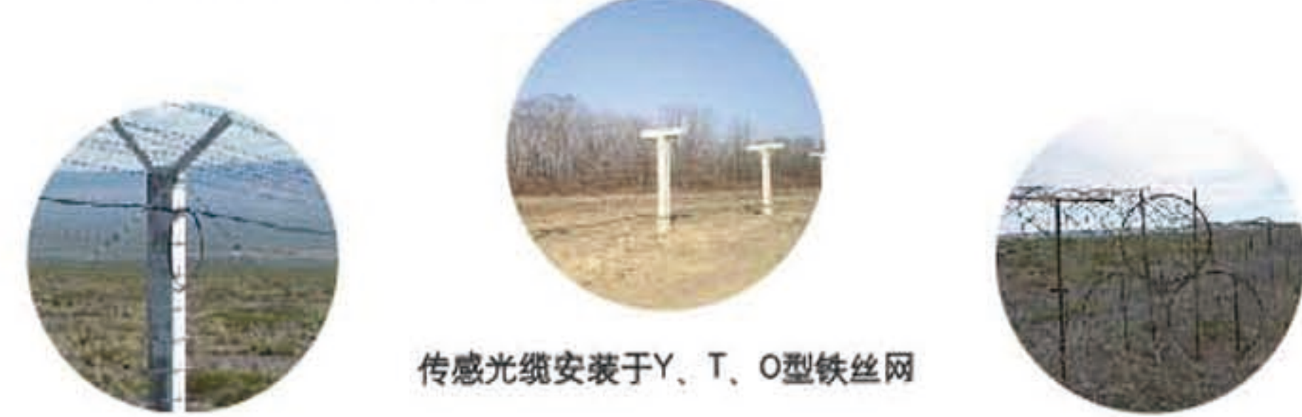
传感光缆安装于Y、T、O型铁丝网

DSC-DVS分布式光纤测震系统以光缆作为传感器，可以沿防范区域的周界埋入地下、绑扎在护栏上或植入墙体。当事件发生时，其产生的振动或者压力可以被光缆所探测并将外界入侵信号传输到信号处理中心，最后由控制中心发出相应的警报并给出具体入侵发生的位置。系统具有较高的灵敏度，由于内植了智能判断系统，可以对入侵行为进行智能识别并分类，具有较高的报警率和极低的误报率。常用于：机场、仓库、军事禁区、边境线等。